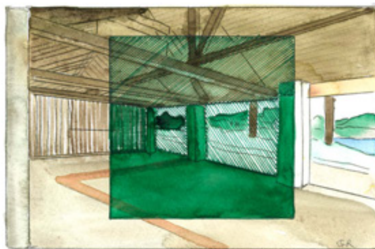
“Paraty, projet”, 2010, aquarelle, 13 x 20 cm

vernissage samedi 6 novembre de 14 à 20 heures